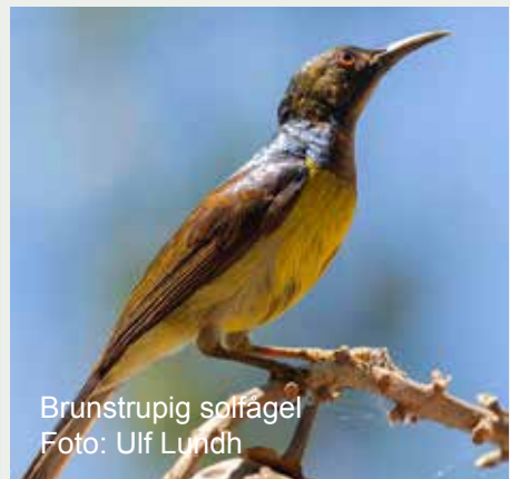
Brunstrupig solfågel