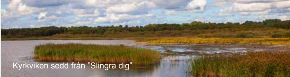
Kyrkviken sedd från "Slingra dig"