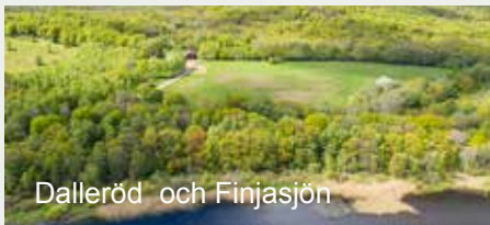
Dalleröd och Finjasjön