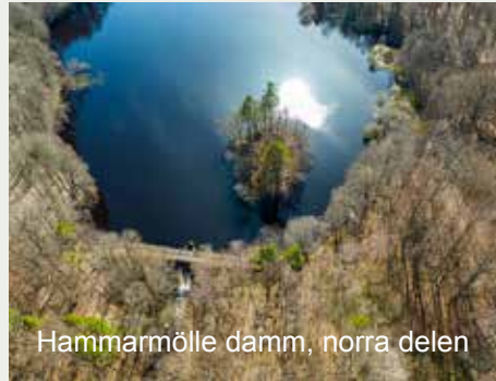
Hammarmölle damm, norra delen

Länk: http://www.webbkameror.se/djurkameror/stork/