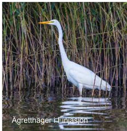
Ägretthäger i Finjasjön