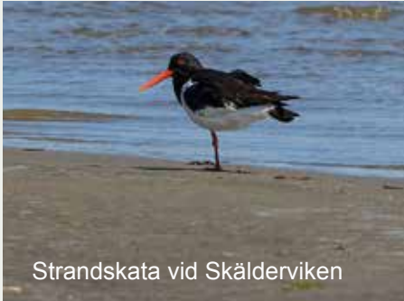
Strandskata vid Skälderviken