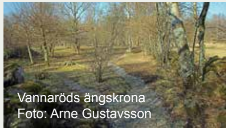
Vannaröds ängskrona