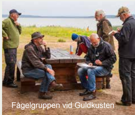
Fågelgruppen vid Guldkusten

Ökar smittspridningen (covid-19) kan vi tvingas byta till annan lokal än "Spindelns"!