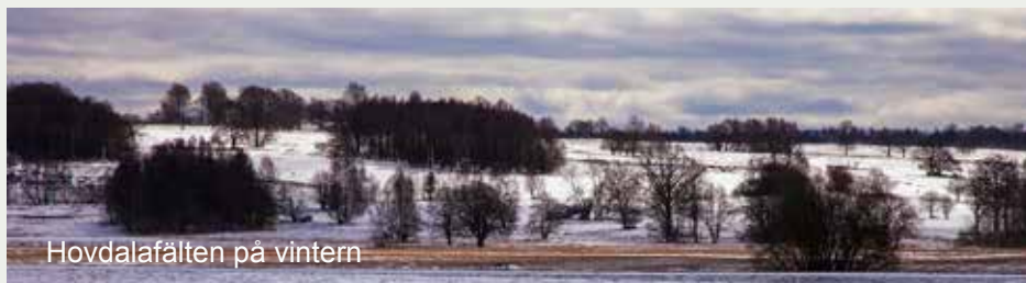
Hovdalafälten på vintern