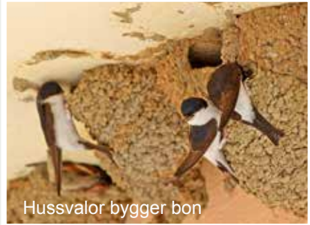
Hussvalor bygger bon