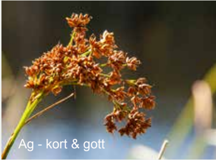
Ag - kort & gott

Gotländskt takmaterial. Sällsynt i Skåne, vanligt på Gotland. Floragruppen besökte Svanshallssjön norr om Osby och fann fina bestånd av strandväxten ag .