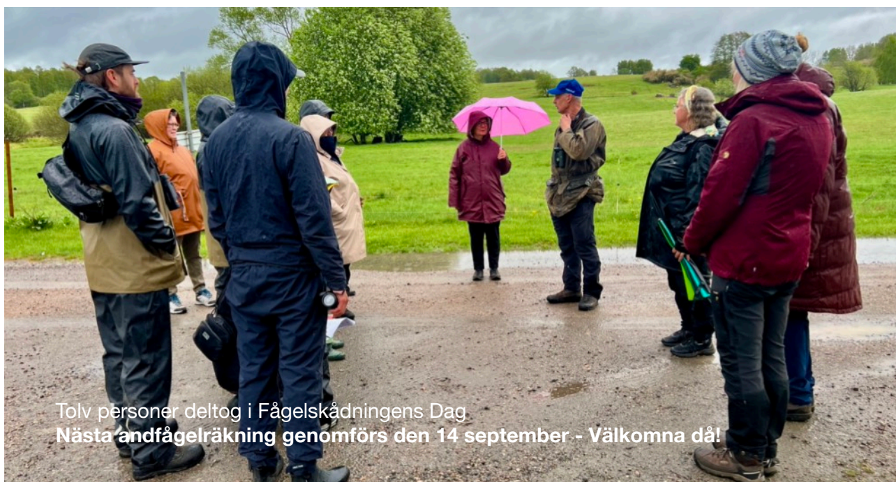
Tolv personer deltog i Fågelskådningens Dag Nästa andfågelräkning genomförs den 14 september - Välkomna då!

Kommentarer: Skrattmåsar häckar i Magle och Stoby våtmarker. Möjligen även på Lillön. Våren har varit nederbördsfattig och tidig. Tättingarnas antal är högst sannolikt underskattade, delvis beroende på uselt väder! Vi genomförde även Fågelskådningens Dag!